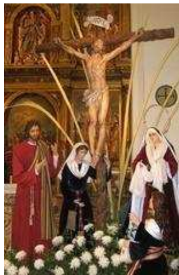
Jesús en el Calvario