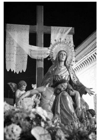
Jesús y la Piedad