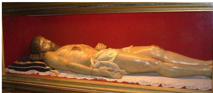
Jesús Yacente en el Santo Sepulcro